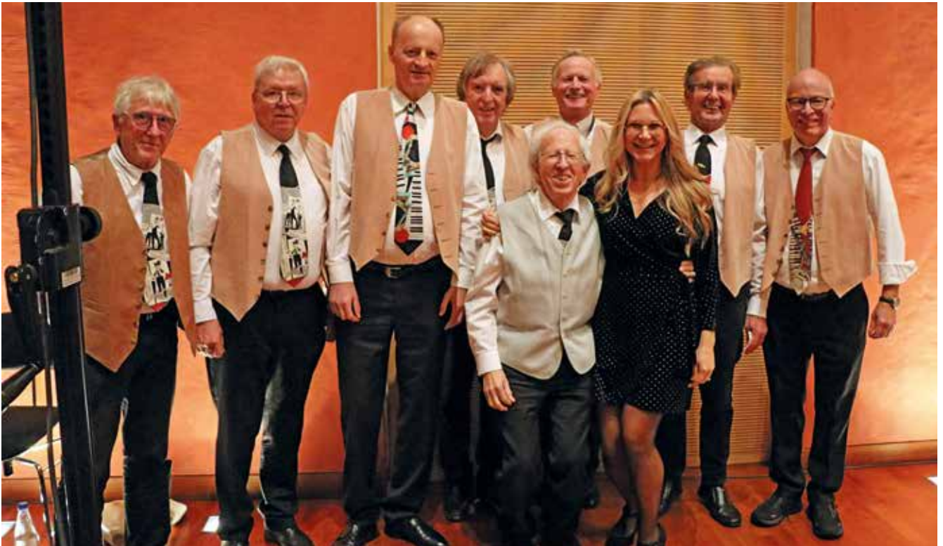
New Orleans Connection Jazzband

großem Erfolg. Als Erzähler-Duo spannen die Beiden mit ihren Geschichten, Gedichten und Anekdoten einen wunderbaren literarischen Bogen rund um die Weihnachtszeit.